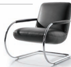
Sessel ARMCHAIR 2230