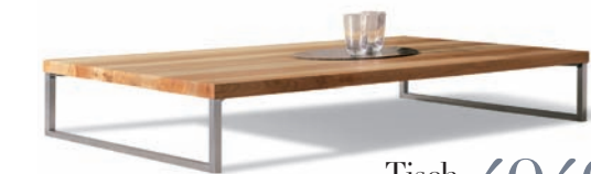
Tisch TABLE 4040