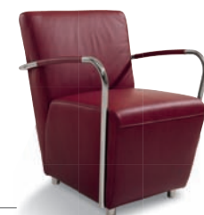
Sessel ARMCHAIR 2170