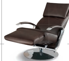
Relaxsessel RELAXCHAIR 2070