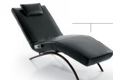
Relaxliege RELAXING RECLINER 2260

WHAT LOOKS GOOD WITH YOUR NEW DREAM SOFA? SELECT YOUR FAVORITES JUST ON WWW.SENECA-POLSTERMOEBEL.DE