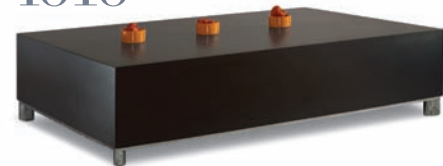
Tisch TABLE 4010